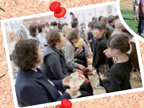
ふれあいのフどい (保育園児との交流)