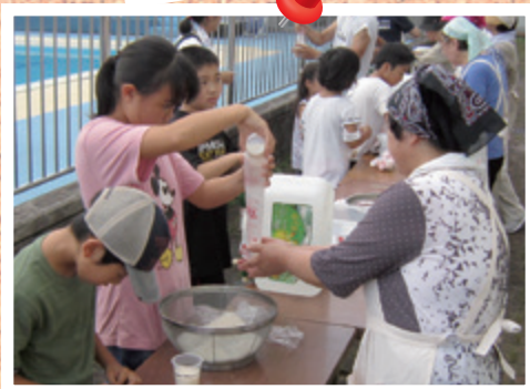
赤十字奉仕団 (新地小での防災教室)