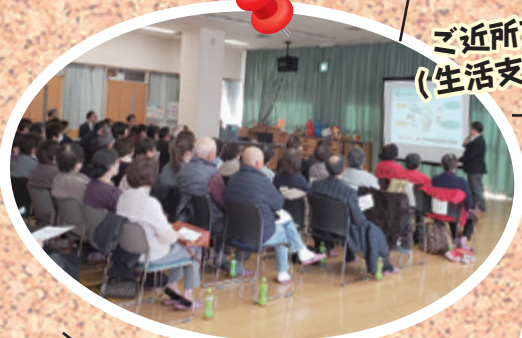
近所支えあい勉強会 (生活支援体制整備事業)