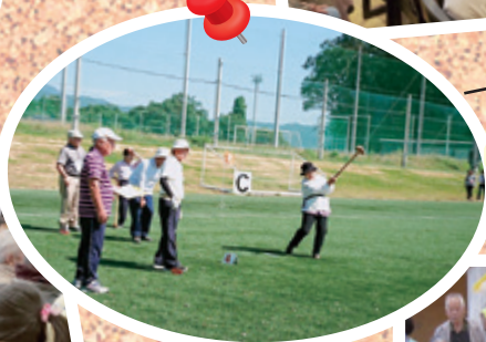
身体障がい者福祉協会 (グラウンドゴルフ大会)