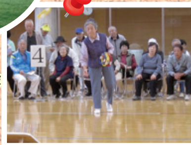
老人クラブ連合会 (輪投げ大会)