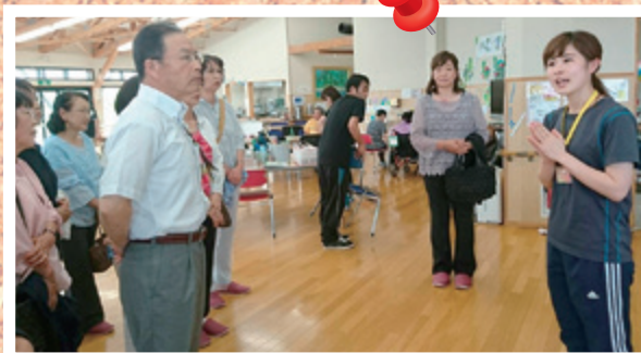
民生児童委員協議会 (視察研修)