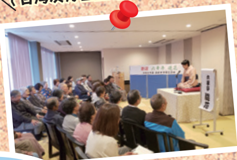
高齢者世帯交流会 (台湾友好基金助成事業)