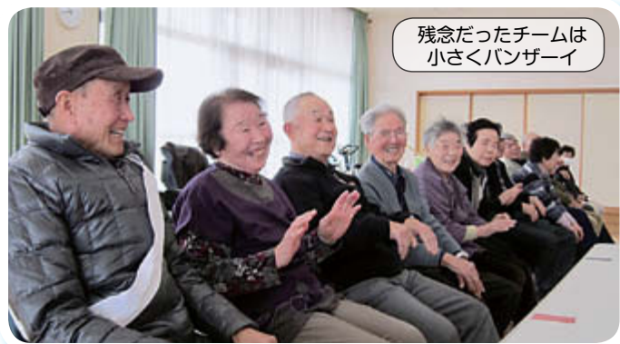
残念だったチームは小さくバンザイ