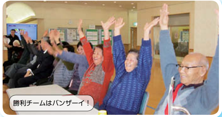
勝利チームはバンザイ!