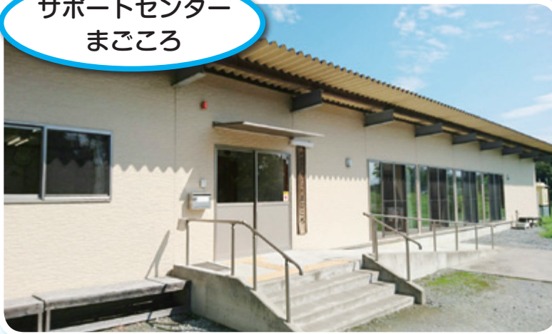
サポートセンター まごころ