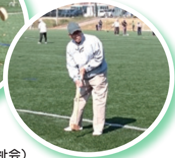
グラウンドゴルフ大会 (相馬身体障がい者福祉会)