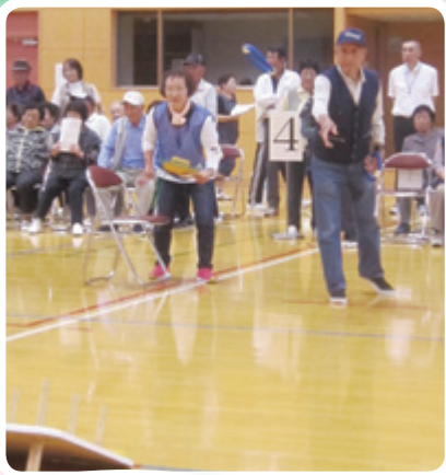
輪投げ大会 (老人クラブ連合会)