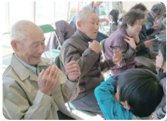
集合サービス(ひとり暮らし高齢者)