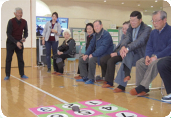
高齢者世帯交流会